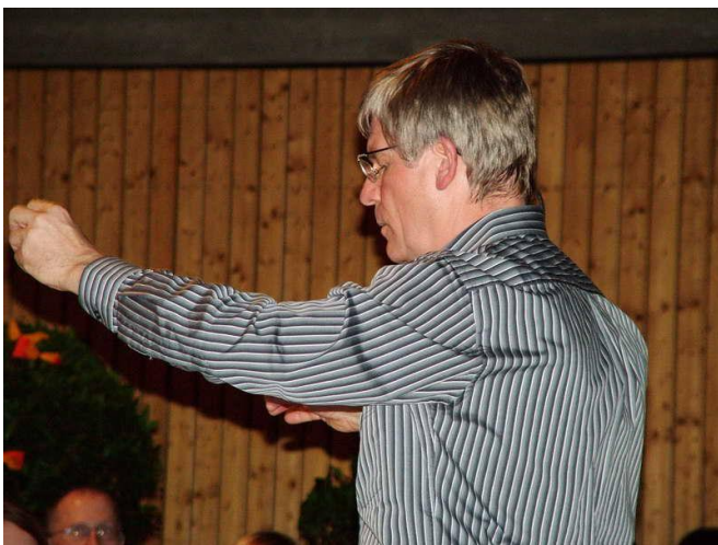
Foto: Herbstkonzert 2009

Mit sehr viel Geduld und Engagement dirigierte er, leitete Registerproben, verbrachte Stunden mit der Auswahl neuer Stücke, fuhr für Wochenendauftritte oft extra aus Kehl zu uns, schrieb Arrangements um und lenkte uns durch schier unspielbar scheinende Passagen. Die Liste ließe sich fortsetzen. Für jedes Konzert spornte er das Orchester dazu an, „Eins drauf zu setzen“ und musikalisch neue Wege einzuschlagen. Seine exakte Probenarbeit, die er mit vollem Körpereinsatz betrieb, folgte stets klaren Klangvorstellungen. Dabei verlor er jedoch zwei Dinge nie aus den Augen: den Spaß am gemeinsamen Musizieren und die Förderung des Zusammenhalts innerhalb der Gruppe.